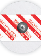
EK-S 50 PSG

Ø 50 mm żel stały pianka polietylenowa opak. jedn.: 50 szt. opak. zbiorcze: 1500 szt.