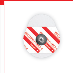
EK-S 42 PSG

42 x 36 mm pianka polietylenowa opak. jedn.: 50 szt. opak. zbiorcze: 2000 szt.