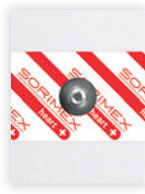
EK-S 44 PSG

44 x 30 mm żel stały pianka polietylenowa opak. jedn.: 50 szt. opak. zbiorcze: 2000 szt.