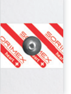
EK-S 56 P

55 x 35 mm żel ciekły pianka polietylenowa opak. jedn.: 50 szt. opak. zbiorcze: 1500 szt.