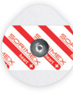
EK-S 45 PSG

45 x 42 mm żel stały pianka polietylenowa opak. jedn.: 50 szt. opak. zbiorcze: 1500 szt.