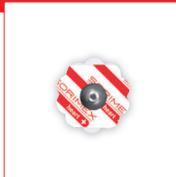
EK-S 25 PSG

Ø 25,7 mm pianka polietylenowa opak. jedn.: 50 szt. opak. zbiorcze: 2500 szt.