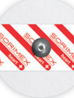
EK-S 55 PSG

Ø 55 mm żel stały pianka polietylenowa opak. jedn.: 50 szt. opak. zbiorcze: 1500 szt.