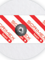
EK-S 50 P

Ø 50 mm żel ciekły pianka polietylenowa opak. jedn.: 50 szt. opak. zbiorcze: 1500 szt.